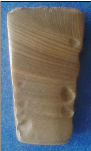
Кременева сокира (вигляд з двох боків). Шкільний музей у Черниляві (2014 р.)

Культуру кулястих амфор (назву отримала від опуклобокої посудини – амфори – з двома або чотирма вушками під краєм горловини) репрезентують тут сокира і долото з кременю.