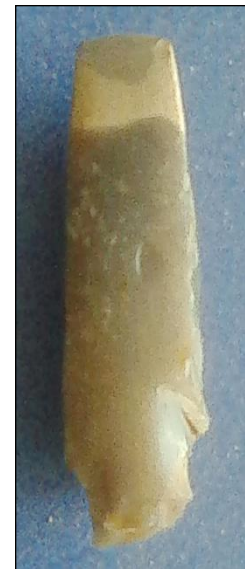
Кременеве долото. Шкільний музей. (2014 р.)

Кременеве долото, знайдене в Черниляві, майже чорного кольору із світло-сірими цятками і плямками, за обрисами прямокутне з аналогічним поперечним перетином. Висота виробу становить 6 см, ширина – 1,8 см і товщина – 1,5 см. Його грані, крім обушка, повністю зашліфовані. Під час використання у минулому цей предмет зламався, і тому майстер-кременяр підправив його верхню частину для подальшого використання під час обробки деревини.